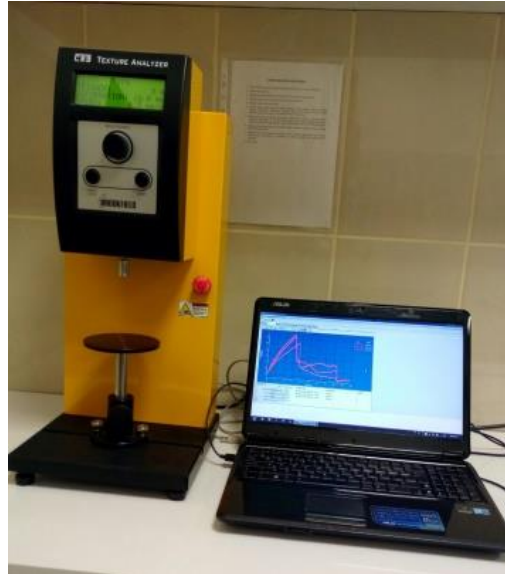
Şekil 1. Yaprakların kopma kuvvetinin belirlenmesinde kullanılan tekstür analiz cihazı